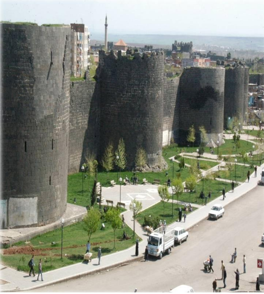
Sur Diplerinin Yeni Hali