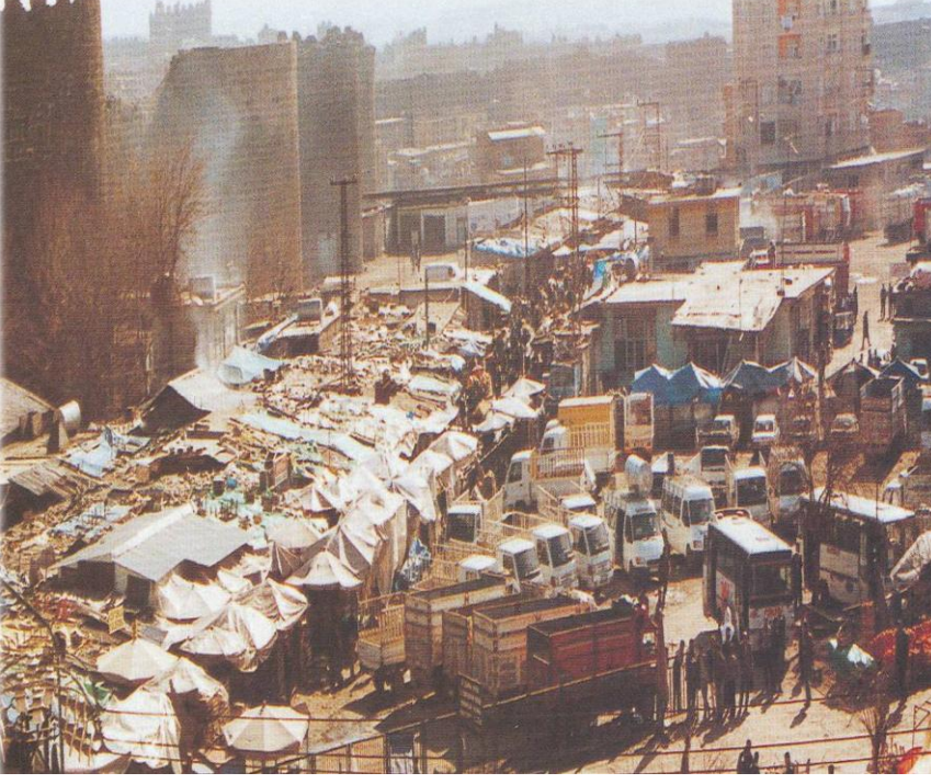
Sur Diplerinin Eski Hali